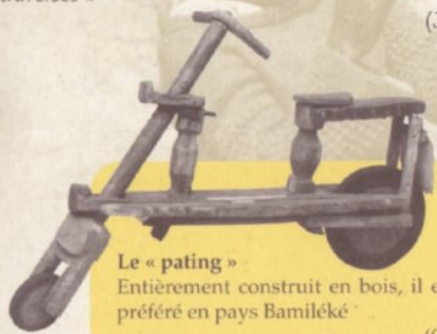
Le « pating »

Entièrement construit en bois, il est le jouet préféré en pays Bamiléké