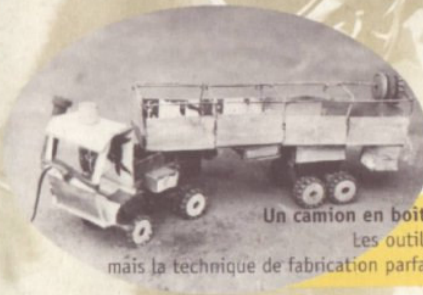
Un camion en boîtes de conserve...

- Quelques jouets ont été achetés dans une fête scolaire ou auprès d'un commerce artisanal... géré par des enfants.