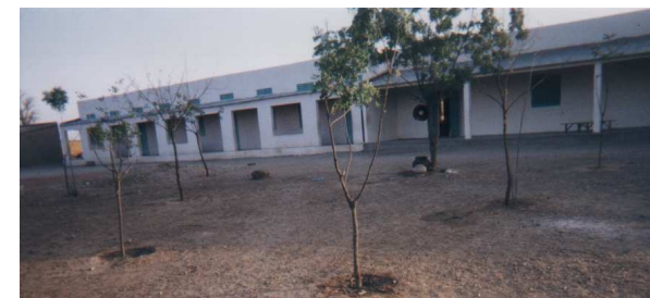
Les trois nouvelles classes