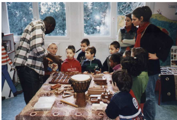
Animation avec un artisan

Wotoroni est affiliée à la Fédération nationale Peuples solidaires